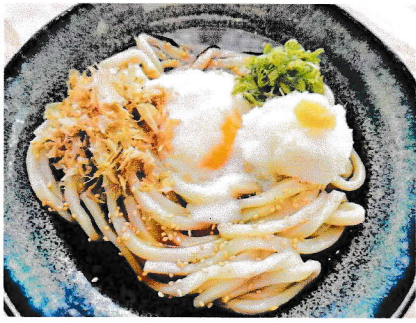
冷やしうどん (そば)