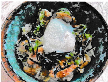
やきとり丼 半熟玉子のせ