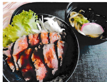
ローストビーフ丼