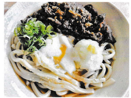
冷やし肉玉うどん