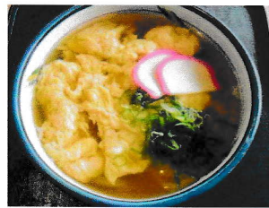
玉子とじうどん (そば)