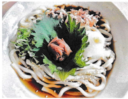
梅しそおろしうどん