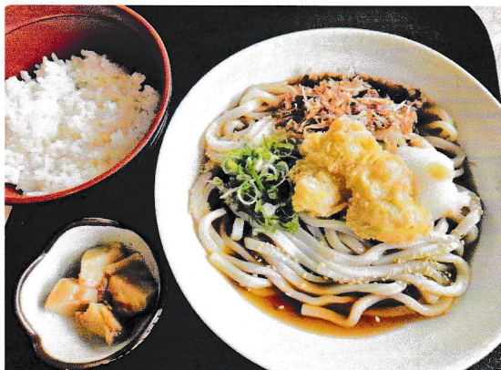
ランチ 冷やしうどんセット 850円(税込み)

★上記の定食類に付いている味噌汁をミニうどんに変更(+100円) ※温うどんのみ ★御飯大盛(+50円)