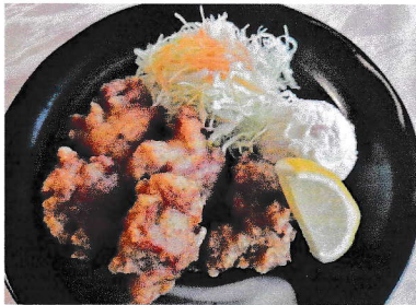
ランチ からあげ定食