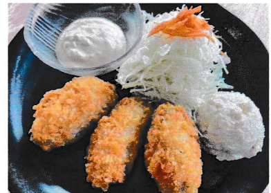
ランチ カキフライ定食