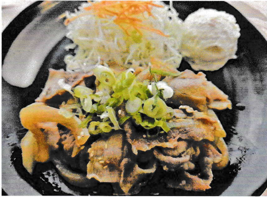
ランチ しょうが焼き定食