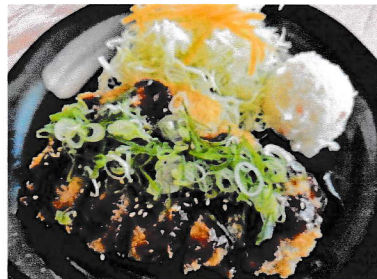
ランチ みそカツ定食 (三元豚)