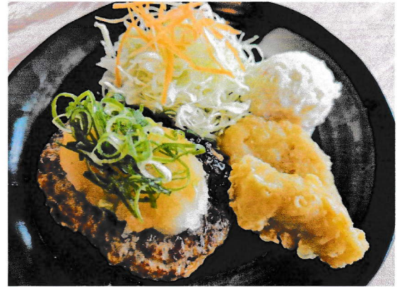
ランチ おろしハンバーグ定食