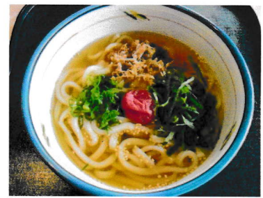
梅しそうどん (そば)