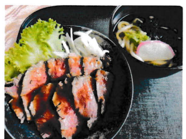
ローストビーフ丼