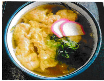
玉子とじうどん (そば)