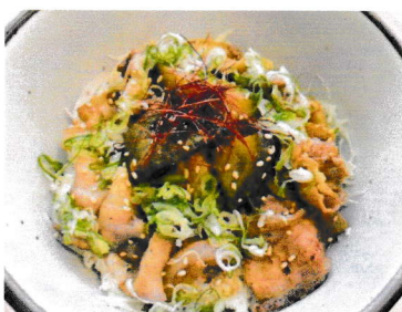
犬鳴ポーク 生姜焼き丼